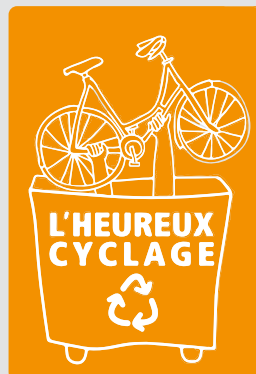
Illustration de couverture : Camille Bissuel - www.nylhook.art / Icones : Gordon Johnson

contact@heureux-cyclage.org 04 58 00 38 73 www.heureux-cyclage.org www.wiklou.org